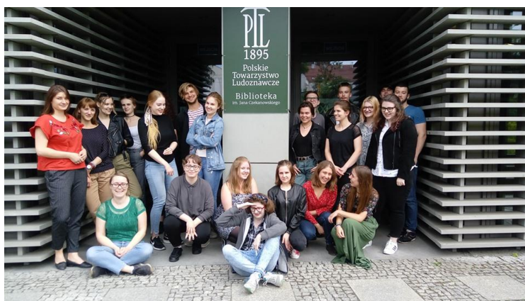
Studentki i studenci poznańskiej etnologii przed siedzibą PTL, fot. A.W. Brzezińska